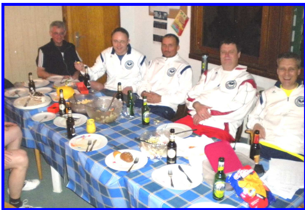
Gesellige Zusammenkunft nach einem Tennismatch

im Vordergrund der Aktivitäten. Wir hoffen sehr, hier zum Wohle der Gesundheit der Tennisspieler und auch somit in Ihrem Interesse gehandelt zu haben. Es wurde zur Winterrunde ein 9,0 mm starker Strukturvelour- Belag eingebracht, der laut Hersteller „mit Perfect Glide ein Spielen wie auf Asche“ verspricht. Die unempfindliche Belagoberfläche soll ein besseres Drehverhalten und somit unübertroffenen Laufkomfort mit deutlicher Gelenkschonung bieten. Wir freuen uns auf die verbesserten Spielbedingungen in dieser Wintersaison. An Hallenstunden Interessierte können sich an Tennishallenvermietung wenden.